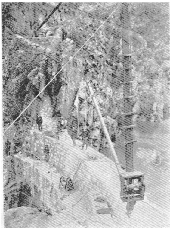
COLONAMIENTO DEL TRANQUE