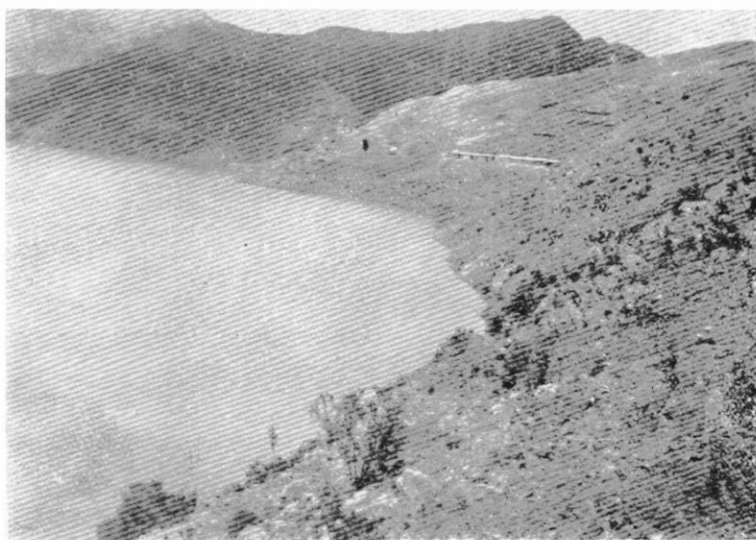
VISTA JENERAL DEL EMBALSE