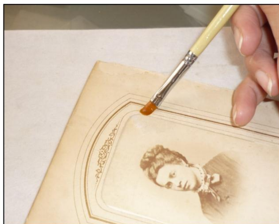
Figura 4. Álbum Fotográfico.

En una primera etapa de este proyecto se decidió restaurar los documentos y fotografías más dañadas de este modo se buscó asegurar su conservación. (Figura 4)