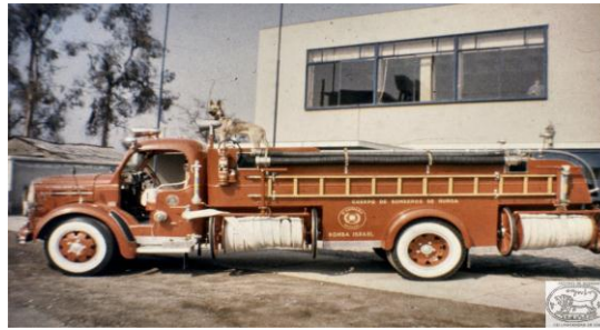
Figura 6. Carro Bomba Israel y el perro Quinta.

Se ha recopilado material de la Comunidad Judía de La Serena, Comunidad Sefaradí de Santiago, del Estadio Israelita Macabi y dos fotografías de Andacollo.