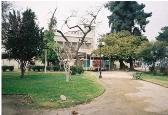
Fig.16. Parte posterior de feria artesanal y actual remate del Parque Gómez Rojas.