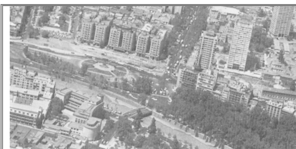
Fig.8. Vista aérea oblicua sobre conjunto monumental de plaza Baquedano y entorno, 1979.