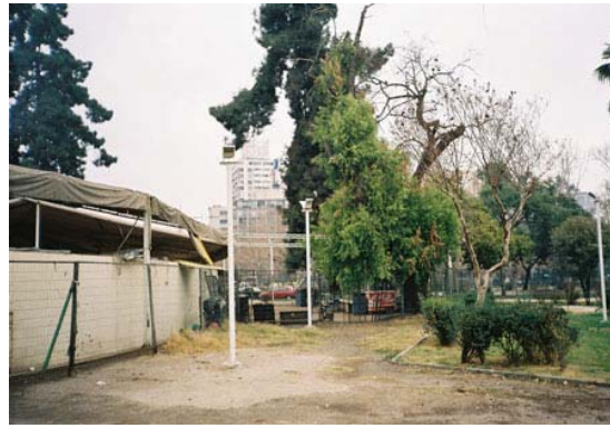
Fig.17. Vista posterior de feria artesanal y deterioro que provoca esta, en el Parque Gómez Rojas.

Se da paso luego a intervenciones rentables -toda vez que están sobre bienes públicos- que terminan de desvirtuarlos y que son presentados como proyectos "espectaculares". Es lamentable que cada día retrocedamos en materia de urbanismo, urbanidad, civilidad y calidad de vida, y que las diversas autoridades encargadas de proteger los parques bienes nacionales de uso público no estén cumpliendo su papel.