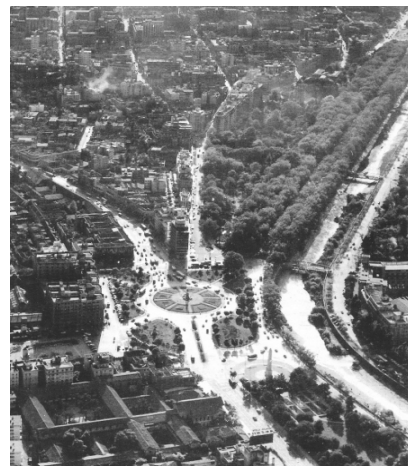
Fig.12. Vista aérea oblicua del conjunto monumental de la Plaza Baquedano, 1960.

5. Adicionalmente, el Parque Gómez Rojas forma hoy parte de uno de los proyectos del Bicentenario, el llamado "Anillo Interior de Santiago", el cual busca generar las condiciones para transformar áreas edificadas deterioradas del centro y pericentro de la capital, aportando una mejor y mayor dotación de espacios verdes, una mejor