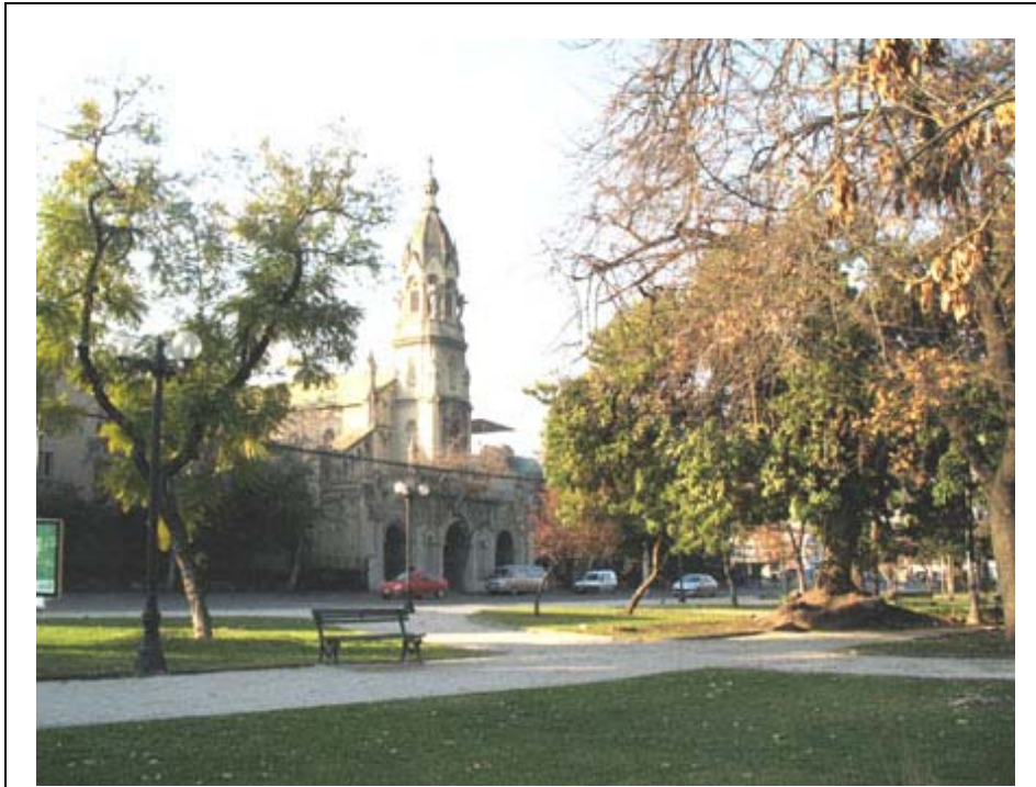
Fig. 10. Iglesia del antiguo Liceo Alemán, ubicada aproximadamente sobre el eje de simetría norte-sur del tramo practicable del Parque Gómez Rojas.