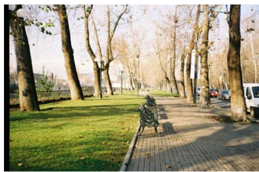
Fig.7. Borde norte del Parque Forestal junto al Mapocho y frente al Parque Gómez Rojas.