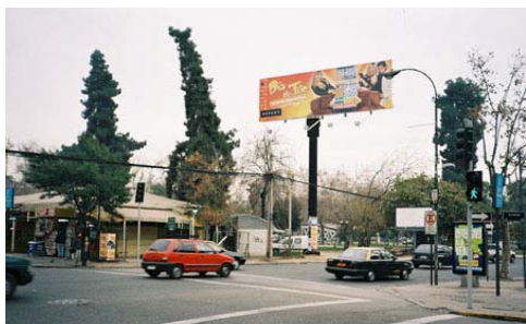
Fig.14. Feria artesanal y uno de los cinco letreros de gran formato sobre el Parque Gómez Rojas.

Desde hace algún tiempo observamos en diversas partes de la ciudad, una especie de estrategia al entregar a ciertos usos privados los espacios públicos -como es el caso de la feria artesanal en sitio, y la instalación de propaganda en letreros en gran densidad y todos los formatos- generándose, así, un severo deterioro paisajístico y una paulatina desaparición de las especies vegetales.