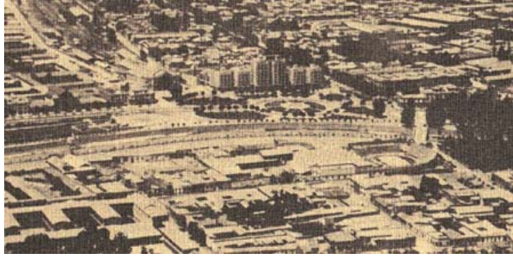
Fig.1. Acometida del Parque Gómez Rojas en calle Pío Nono, c. 1929 (a la derecha de la fotografía).

que el Gobierno de Sanfuentes ordenó reprimir. En esas circunstancias Gómez Rojas fue detenido, enfermado gravemente de meningitis y falleciendo a la edad de 24 años 4 .