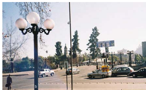
Fig.15. Las tres especies verdes de gran formato que restan en la zona que ocupa la feria artesanal del Parque Gómez Rojas.