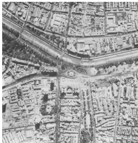
Fig.11. Vista aérea vertical del conjunto monumental de la Plaza Baquedano, 1979.