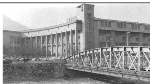
Fig.9. Edificio de la Facultad de Derecho de la Universidad de Chile, obra del Arqto. Premio Nacional de Arquitectura J. Martínez Gutiérrez, Escuela Movimiento Moderno, 1938.