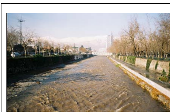
Fig.6. Río Mapocho frente a los Parques Gómez Rojas (iz.) y Parque Forestal (der.).