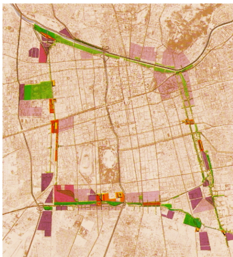
Fig.13. El "Anillo Interior de Santiago", incluyendo el Parque J.D. Gómez Rojas, entre puentes Loreto y Pío Nono, proyecto del Bicentenario.

conectividad, más servicios, en suma, un mayor grado de urbanidad en estos espacios 7 .