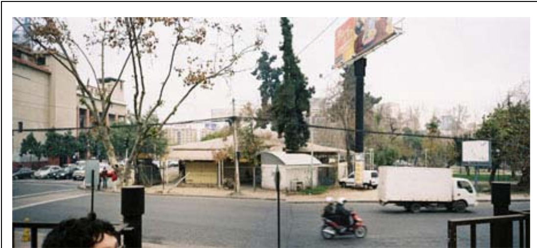
Fig.4 Imagen de feria artesanal autorizada sobre acceso principal del Parque J.D. Gómez Rojas, frente a la Facultad de Derecho de la U. de Chile, incluyendo letreros de propaganda de variados formatos.

2. El status de Bien Nacional de Uso Público le fue confirmado en el Plan Intercomunal de Santiago aprobado desde 1960, y como parte de las 690 hás ubicadas dentro de los límites urbanos de este plan, destinadas a espacios verdes y recreacionales junto al río Mapocho ("Cuenca del Río Mapocho") 6 .