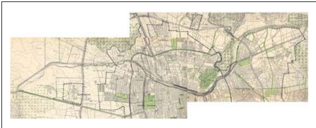
Fig.5. Segmento de plano con proyecto oficial Plan Intercomunal de Santiago (Áreas Verdes), aprobado desde 1960, disponiendo 690 hás en las riberas del Mapocho como Bien Nacional de Uso Público para uso en espacios verdes. Fte.: PAVEZ R., M. Isabel (comp.); PARROCHIA, Juan, (autor de contenidos). 1994, op. cit.

2. El status de Bien Nacional de Uso Público le fue confirmado en el Plan Intercomunal de Santiago aprobado desde 1960, y como parte de las 690 hás ubicadas dentro de los límites urbanos de este plan, destinadas a espacios verdes y recreacionales junto al río Mapocho ("Cuenca del Río Mapocho") 6 .