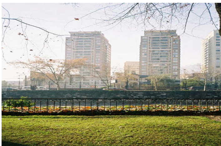
Fig.18. Imagen mostrando el comienzo de una nueva densificación del borde norte de calle Bellavista, frente a club privado de tenis, también en espacios del antiguo parque, la que será seguida de la densificación recién anunciada en Bellavista con Pio Nono.

Pensamos que tanto por las razones antes expuestas, como por el hecho de estarse densificando en población residencial y en edificación el frente norte de Bellavista, y más temprano que tarde, el interior de este barrio -lo que traerá como consecuencia necesidades mayores de espacios verdes practicables por todos los grupos etarios-, la única intervención posible en el espacio del Parque Gómez Rojas es su restauración como tal. Debe recordarse que los estándares de superficie de espacios verdes por persona son hoy en Santiago muy inferiores a lo deseable.